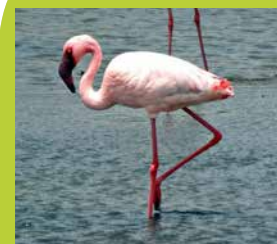
Kleine flamingo Tanzania

In het wild leven er zes verschillende flamingosoorten. Waar de Cubaanse flamingo felroze is, heeft de grote flamingo juist een wit verenkleed.