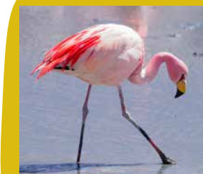
James flamingo Zuid-Amerika