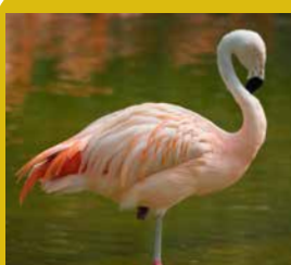
Chileense flamingo Andesgebergte