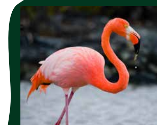
Cubaanse flamingo Caribisch gebied