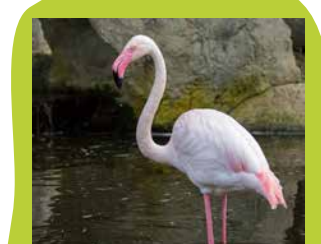
Grote flamingo Europa, Afrika en Azië