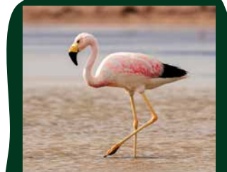
Andes flamingo Andesgebergte